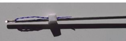
Fils DH en PDO

➔ FILS "I-Threads" ou "Fils Courts" ou "Fils Modelant" : il s'agit de fils courts qui sont placés un par un, les uns à côté des autres afin de constituer un maillage plus ou moins dense.